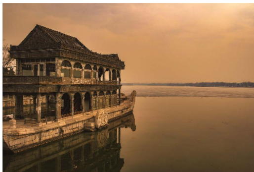
1. ábra. Az ábra címe.